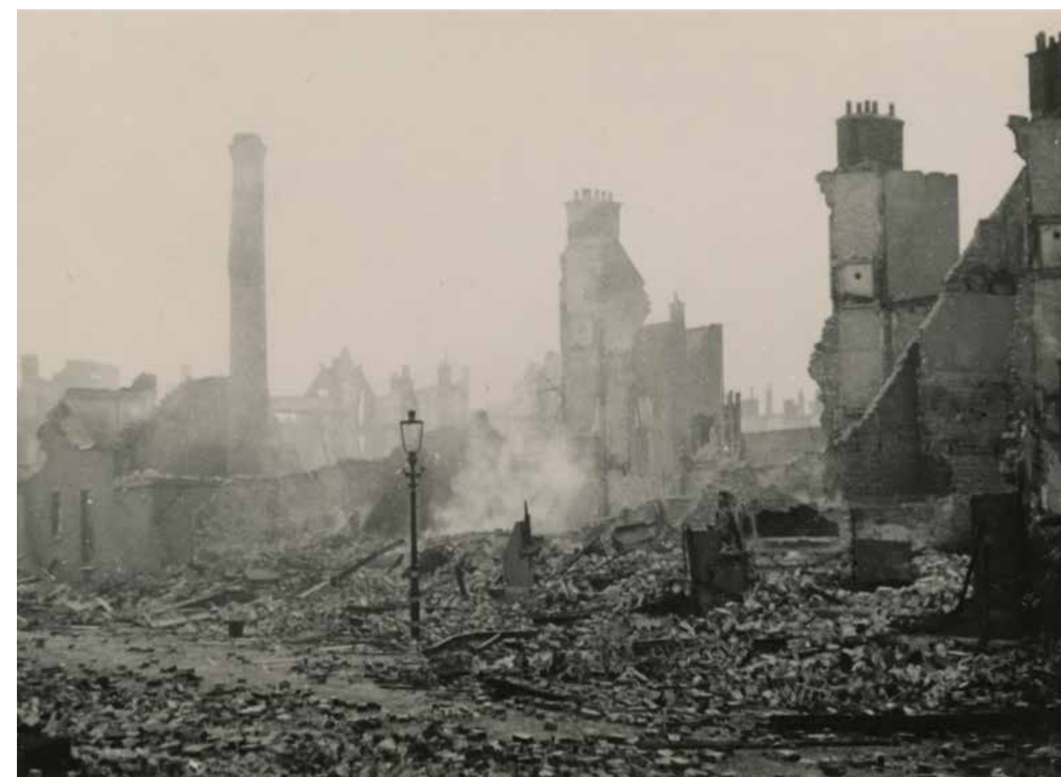
Een straat in het Bezuidenhout enige dagen na het bombardement; de puinhopen roken nog.