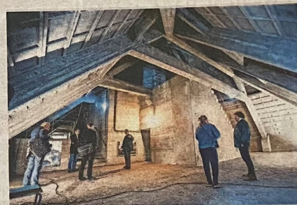
▲ Van buiten een sfeervolle boerderij, van binnen een betonnen hol.