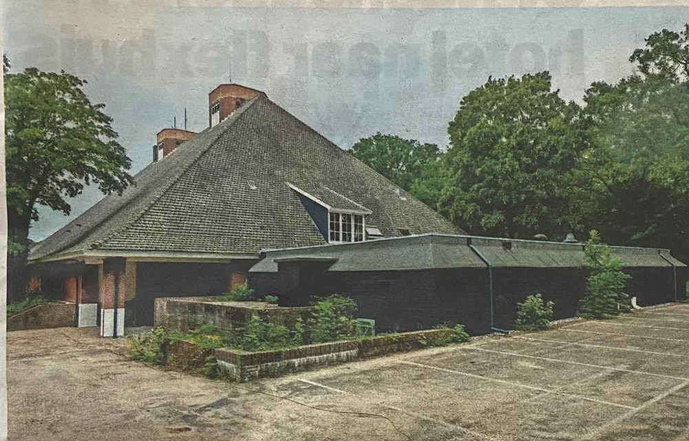
▲ De bunker van Seyss-Inquart op landgoed Clingendael wacht op een nieuwe bestemming.