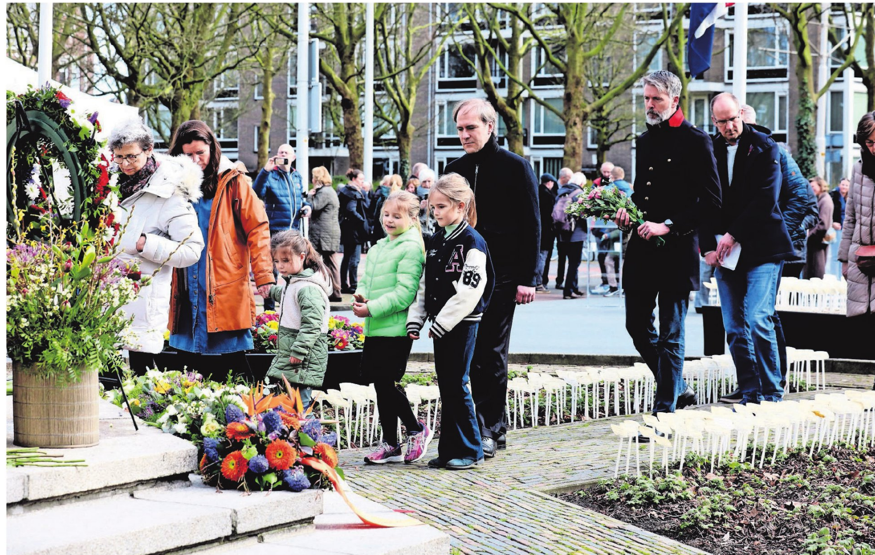
▲ Het bombardement op Bezuidenhout werd zondag herdacht bij het Juliana van Stolbergmonument.