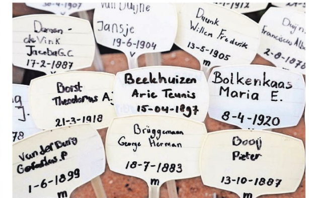
▲ De naamkaartjes waar de namen van alle slachtoffers op geschreven zijn.