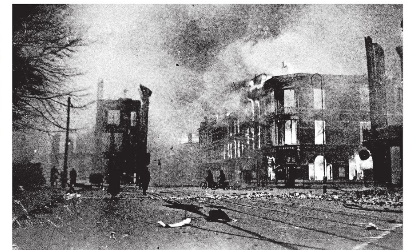
▲ De verwoesting in Bezuidenhout door het bombardement.